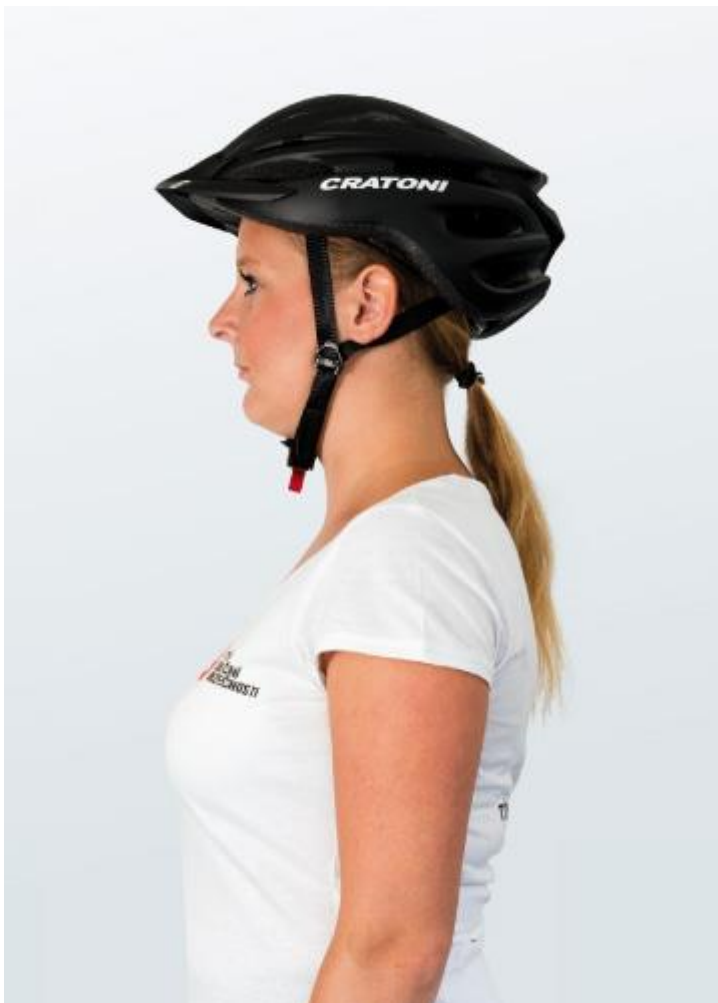
Správně nasazena a upevněna cyklistická přilba